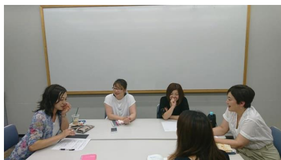
(ピアカウンセリング交流会の様子)

方が、活発に話げできたのが、とても良いと思ひました。ステップファミリーになる前は、どうしても夢を見がちな部分もありますが、先輩ステップファミリーの方からのアドバイスは適格で、夢を見るというよりは、現実を見て幸せになる方法を伝授していたようて有意義な時間になりました。