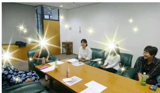
(ピアカウンセリング交流会の様子)

気分転換を図っている様子が伝わってきました。今後は、参加者のみなさんと繋がりを持ちつつ必要に応じたサポートができたらいいのではないかと思います。