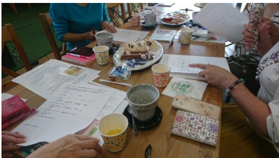
（ピアカウンセリング交流会の様子）

今回の参加者の方々は、シングルマザーから、子連れで再婚をされた方が多かったです。また、その中でも、子連れ同士で再婚をされた方のお話の中で、思春期になる継子のしつけについて、お話をされました。「どこまで手をかけていいのか？」「叱る時はどうしたらいいのか？」など、悩んでいました。参加者の中には、実子が思春期の子の方もいらしたので、主に思春期の子こどもへの対応を共有しました。結果、思春期の子育ては、継子であっても、実子であっても変わらずの苦労があるとのことで結論がでましたが、実子には、叱ることができても、継子には、どうしても遠慮をしてしまう部分があるという継母の意見もありました。