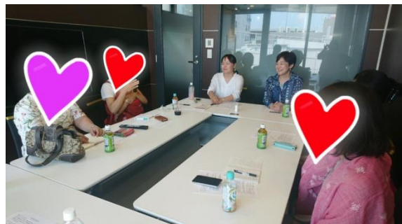
（ピアカウンセリング交流会の様子）

・実子に継父のことを「お父さん」と呼んでくれたらな、と思う。 と、様々な悩みが出てきました。